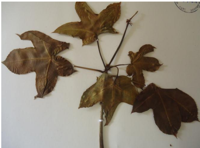
Figura 5 – Pinhão bravo no herbário