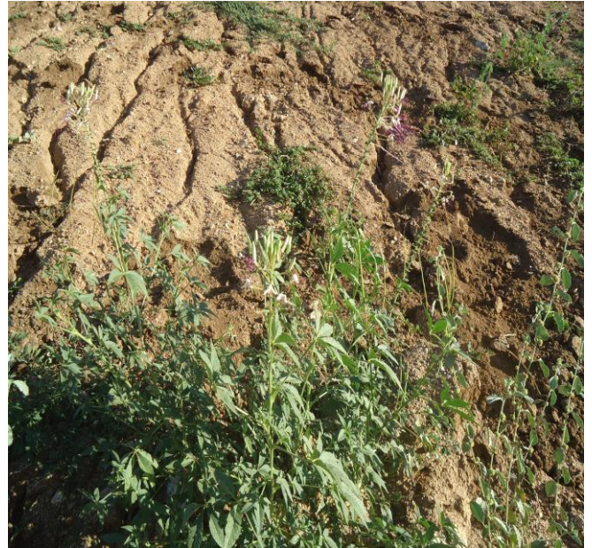
Figura 4 – Presença de Mussambê na região nativa da caatinga