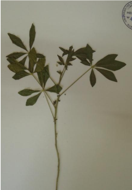
Figura 3 – Planta de Mussambê em herbário